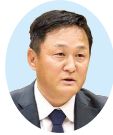
平田 慎一 議員

農業就業人口が減少するといふことは、食糧供給の問題にかかわるだけではなく、農村というコミュニティ、地域や集落の維持にもかかわる問題であり、抜本的な対策が求められる。