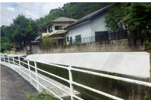
メンテナンスフリー施工後の状況

地域の高齢化が進んでいく中、悪条件下で伐採作業が困難な道路法面、またこれらに隣接した排水路の法面などコンクリート打設によるメンテナンスフリー化を年次的に実施、安全な地域づくりを進めていく。