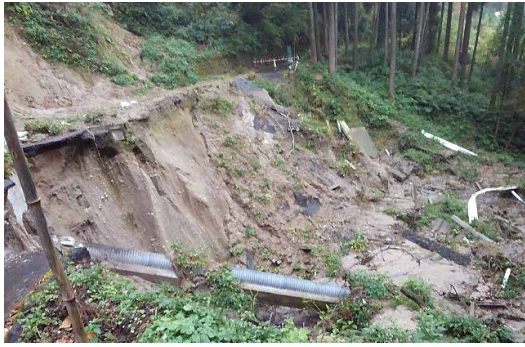
町道崩壊 仮屋谷-松ヶ鼻線