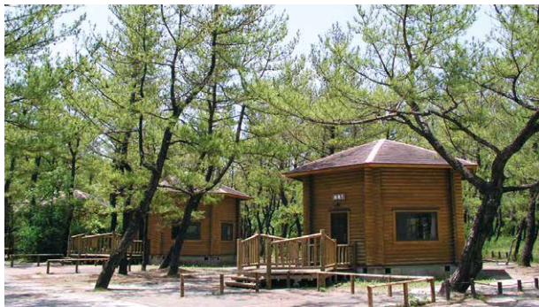
利用者が増えているバンガロー