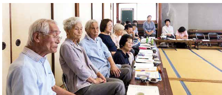
正坂いきいきサロン

果、他の施設と比較しても狭いと感じられた状況である。なお、町では今後計画的に小中学校のトイレの洋式化をはかり、その他の公共施設についても洋式化を進める計画もあることから、早急な対応は難しい状況であると回答があった。