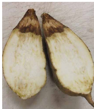
さつまいもの腐敗状況

近隣市町においては、かんしょ事業者だけではなく、かんしょ生産者に対しても、緊急対策にかかる補助金の事業説明会が実施されたと聞いている。なぜ本町の担い手農家や個人農家への周知しなかったのか。また、近隣市町では防災無線による説明会の案内があったが、なぜ本町ではしなかったのか。また、かんしょ事業主体の案内は何社送付したのか。