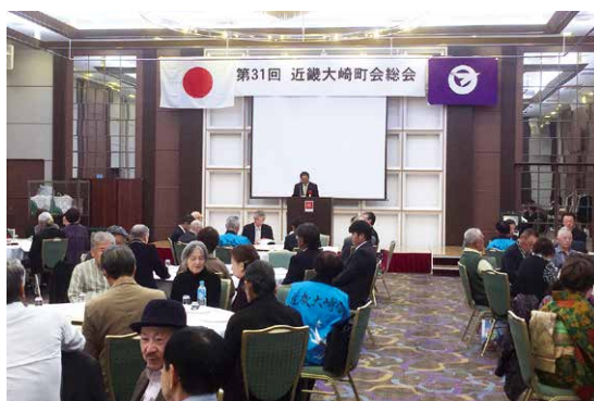
新大阪江坂東急REIホテルにて交流

その後、来賓祝辞のなかで町政報告や議会の活動報告を行い、これからも町民に開かれた議会を目指して活動していくことなどを伝えるとともに、会員の方々との親睦を深めることができました。