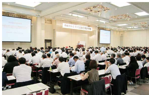
シェーンバツハ・サボールにて研修中

研修を通して、議会への興味を示す内容であるか、市民の関心にこたえる企画であるかなど、住民の立場で編集を行なっているか意識しながら編集する事の重要性や、タイトルや小見出しなどで内容がすぐに理解できるように編集する事で読みやすい紙面となる事などを学ぶことが出来ました。広報広聴常任委員会としても、今回の研修やこれまでの研修で学んだ事を活かしながら編集作業に取り組んでいきたいと考えています。