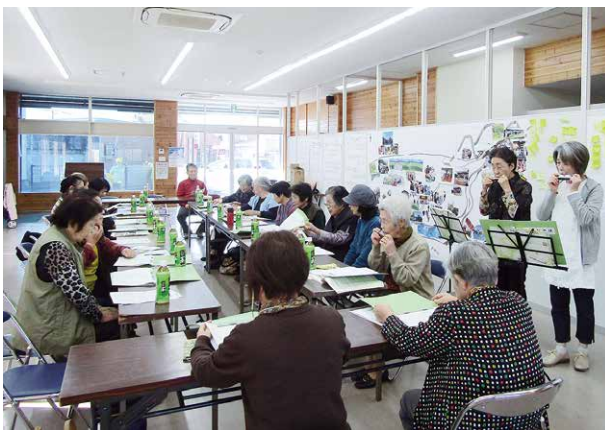
定期的開催されている「ふれあい・いきいきサロン」

築し、公的な福祉サービスと協働して助け合いながら暮らすことのできる「地域共生社会」の実現に向けて、地域の皆さんをはじめ、民生委員・児童委員、ボランティア、行政機関等の様々な団体と連携・協働を図るとともに、地域内外に存在する課題解決に役立つ社会資源を見いだし、そしてそれを上手く活用しながら、自分のこれまでの知識・経験を活かして微力ながら頑張っていきたいと思っています。