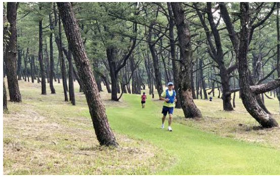
整備されたクロスカントリーコース

手が悪いという声が陸連の方々か ら出ている。コース横に東屋建設 をと声が出ているのも、急な夕立 や軽微な持ち物や飲料水等の置 場がなくて困っているが検討して いただきたい。