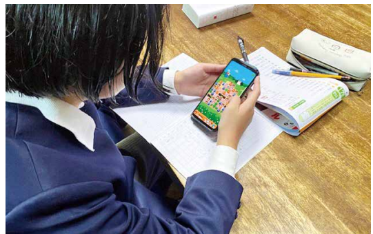
子どもの危機意識が求められるスマートフォン