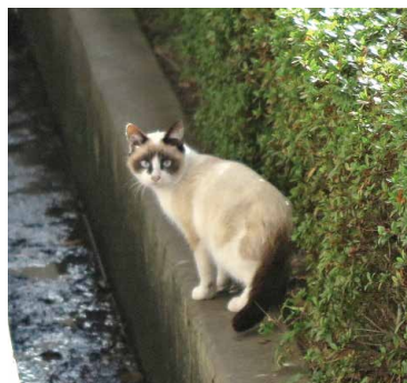
体育館に住みついた猫

る状況の中で、猫などに引っかけたり、糞尿などの飛散から高齢者や妊婦、幼児など抵抗力の弱った人に感染する病気の報告や美観を損なうなどが考えられる。条例制定など行政として対策を講ずるべきであるがどうか。