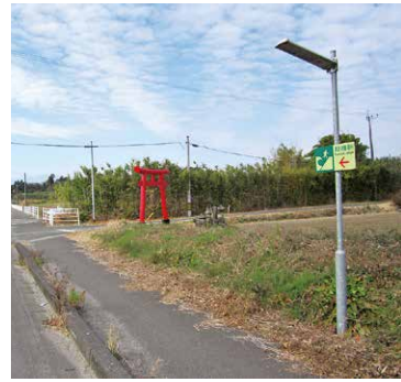
ソーラー式街路灯

災害避難所への誘導確保や、以後の復興にも貢献できることからソーラー式街路灯の設置を進めるべきではないか。