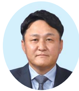
平田 慎一 議員