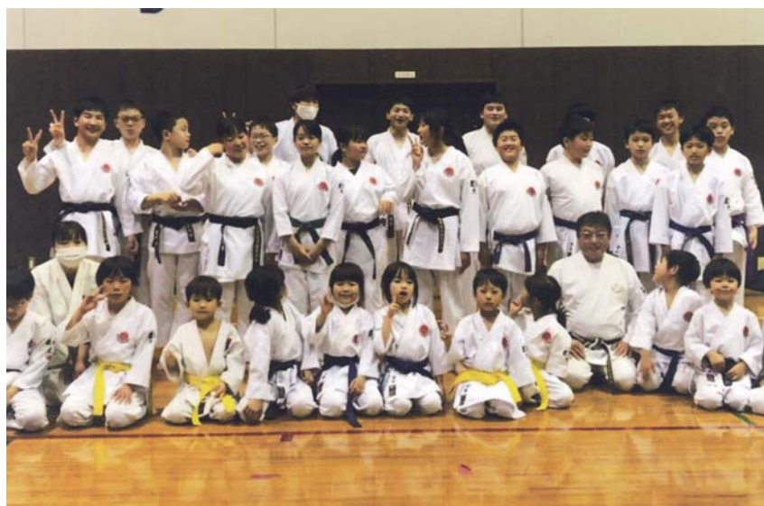
練習後、総合体育館にて

水・金曜日は町の総合体育館で練習しています。興味のある人はぜひ見学に来てください。練習時間午後6時30分～8時30分