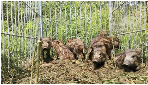
箱罾（餌付け）捕獲状況

問 野方地域の耕作放棄地を初め、国道448号沿いの菱田・益丸・大丸にかけても被害が出ている。くにの松原国定公園内を含む松林周辺がイノシシの住みかになっている状況で、近隣住民の方々やプール・キャンプ場利用者にも人的被害が出る可能性があり早急に対応すべきではないか。