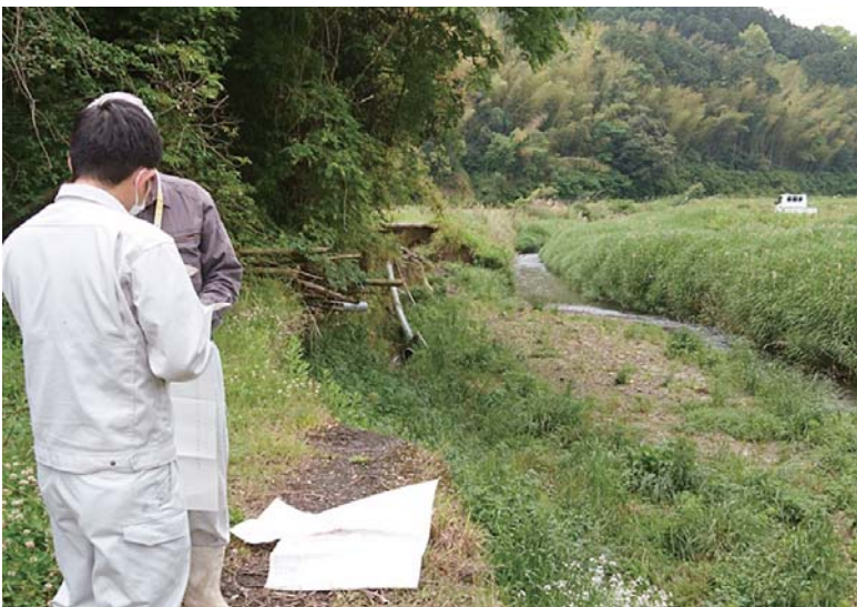
持留地区の破損した配水管

特に水利施設が被害に 遭い作付けできない水田 が多数あり、なかには自 家用米確保のための水田 もある。被害箇所が多く 復旧作業にあたる業者や 国・県の査定などに時間 がかかっている事も理解 できるが、耕作者の為に は明確な復旧時期を示す 必要がある。