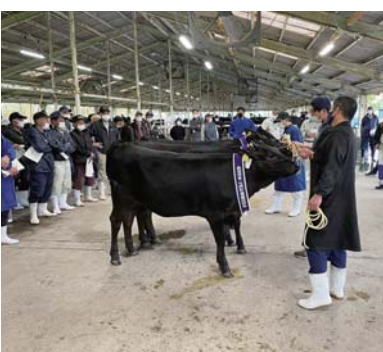
大崎町春季畜産品評会

答 町長 本町から肥育農家の素牛として3頭選抜された。黒牛の宣伝工夫をしていく。