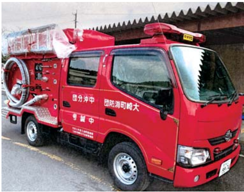
購入予定と同型のポンプ付積載車