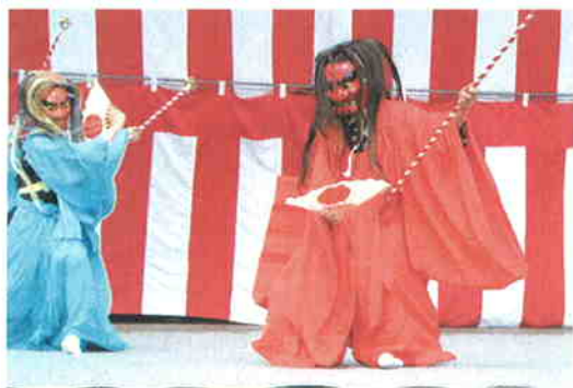
●文化財 照日神社神舞