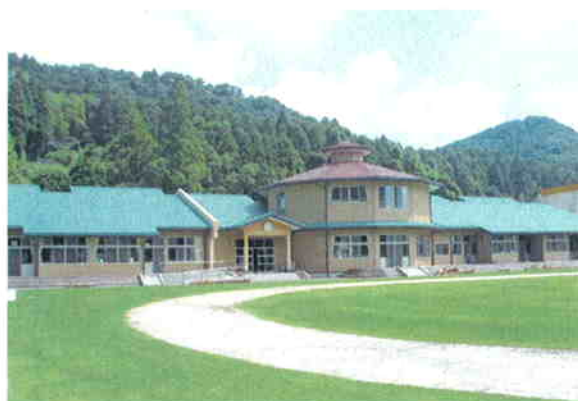
●改築された持留小学校