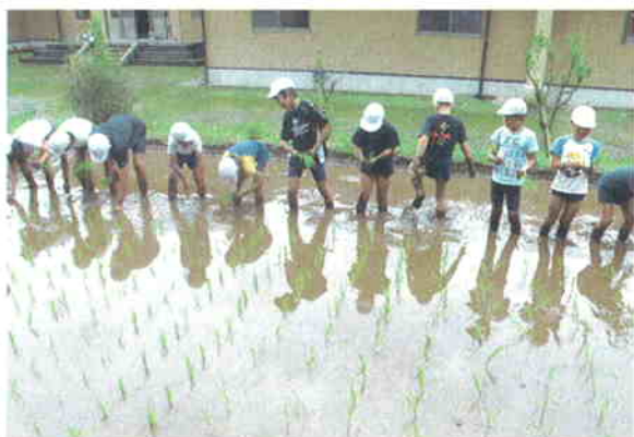
●児童による田植の体験授業