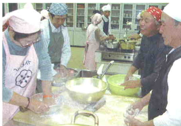
●生涯学習講座 男の料理教室