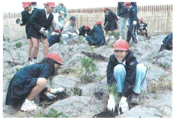
●幼松を植樹する児童の様子