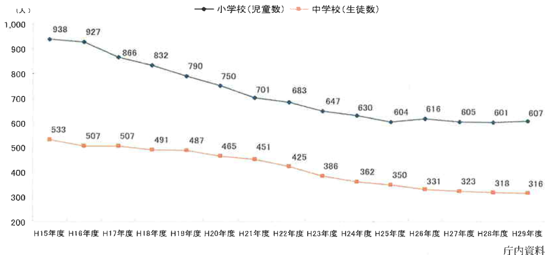
図 小中学校の児童・生徒数の推移