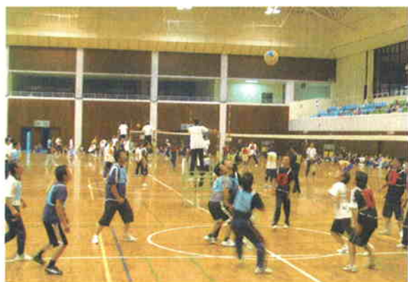
●自治公民館対抗 ミニバレー大会

今後もスポーツ・レクリエーションに対するニーズはますます高まることが予想されており、全ての人々が健康で心豊かな明るい生活を実現するため、誰もが気軽に親しむことのできる生涯スポーツ社会の実現と環境の整備が必要です。