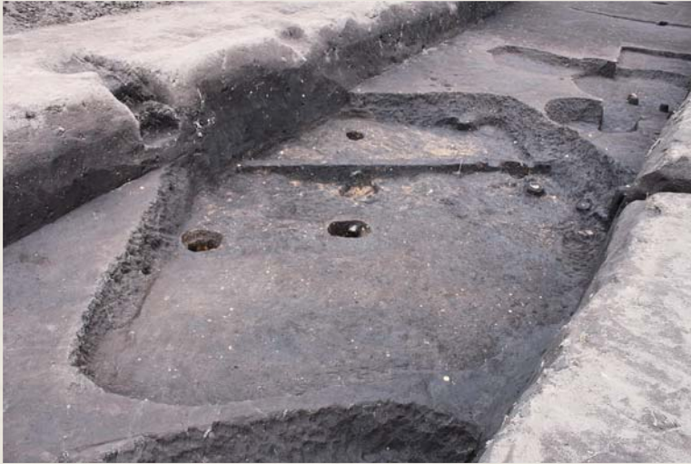
▲古墳時代初頭の住居跡

～自然と歴史を楽しむ散策エリア(持留)～ ② おおさきの歴史を旅してみませんか ⑱