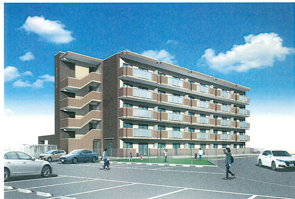
外観透視図(目線図)