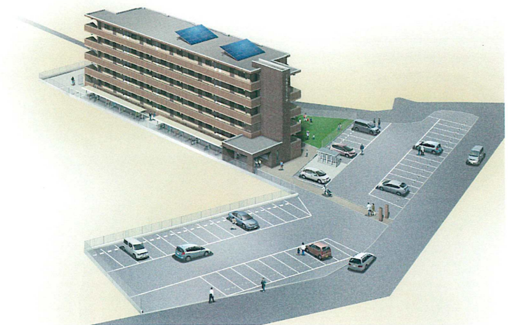
外観透視図(鳥瞰図)