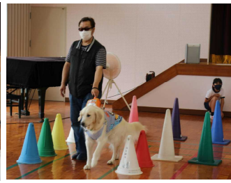
人権コーナーに感想が掲示してありますので是非ご覧ください！