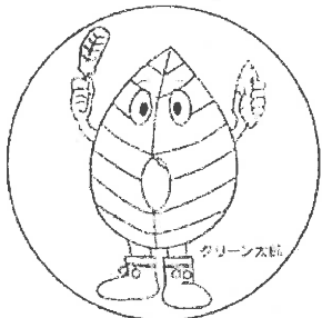
(公財) かごしまみどりの基金 イメージキャラクター