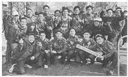
県下一周駅伝肝属チームが ペースメーカーで参戦!