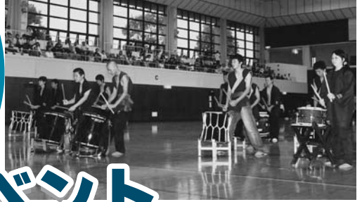
高校生クラブ『響(ひびき)』

第51回を迎えた町民体育祭が、雨天により中止になったため、今年は、大崎町総合体育館において集団演技披露イベントが開催されました。