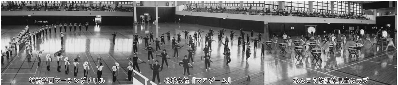
神村学園マーチングドリル

今年に残念ながら、スポーツ競技を行うことはできませんでしたが、披露された各団体の演技は、日ごろの練習の成果がよく表れ、素晴らしい内容でした。