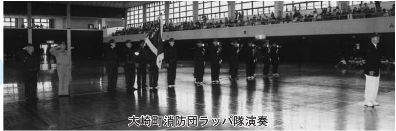
大崎町消防団ラッパ隊演奏

第51回を迎えた町民体育祭が、雨天により中止になったため、今年は、大崎町総合体育館において集団演技披露イベントが開催されました。