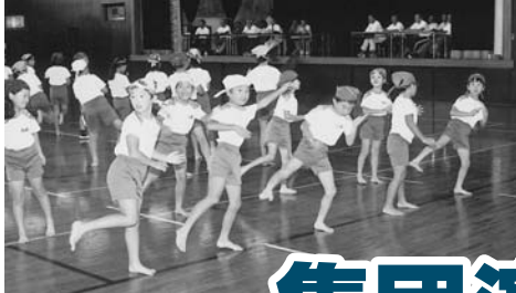
大崎小学校集団演技