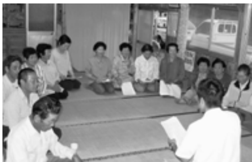
中尾自治公民館での説明会の様子

10月19日(火)、中尾公民館において介護保険、老人医療、介護予防に係る『マスターズプロジェクト』について説明会を行いました。