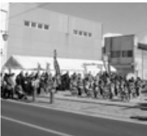
昨年開催された歳の市(南光太鼓)