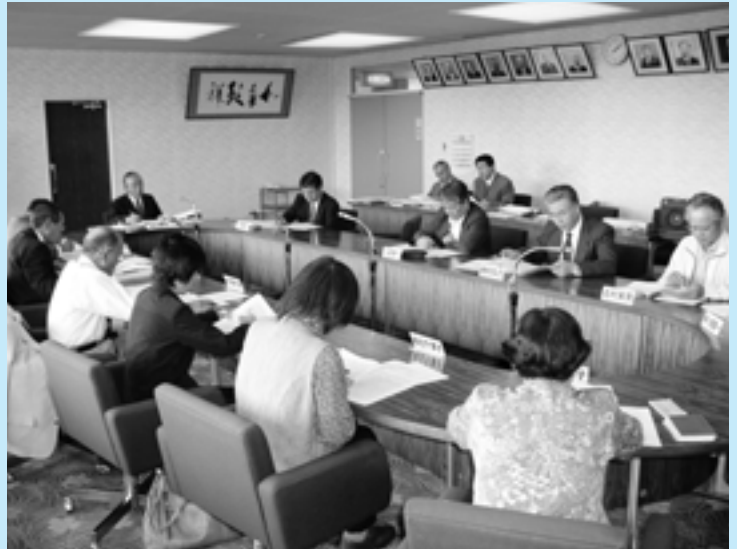
▲ 10 月 27 日に開かれた行政改革調査専門委員会の様子

また今後は、平成 17 年度を起点とし平成 21 年度を目標年度とする『集中改革プラン』の素案についての審議をこの委員会にお願いする予定にしています。