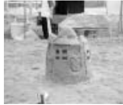
▲持留小学校 『持留城』