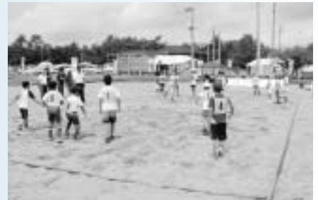
▲ビーチドッジボール