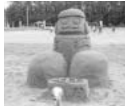
▲菱田中学校 『HIGH FAT SAMO』