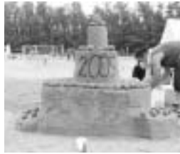
▲大崎第一中学校 『デコレーション・ケーキ』