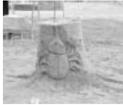
▲立小野小学校 『カブトムシ』