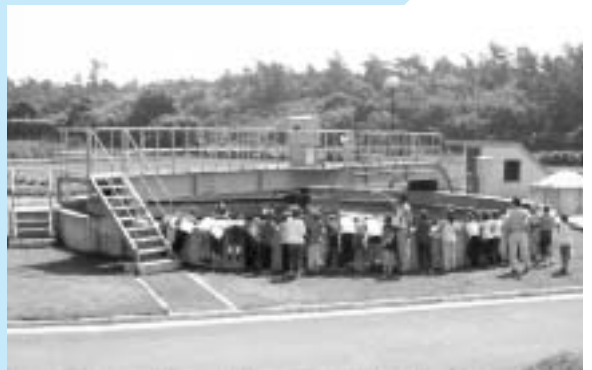
▲大丸小学校4年生の児童が、環境学習の一環で下水道処理施設を研修。「あんなに汚れていた水がこんなにきれいになるんだ。」とみんなびっくりしていました。

現在、公共下水道が利用できる区域では、9割を超える方々が接続されたことにより、集落内の排水路等の悪臭解消や蚊・ハエの発生も減少し、生活環境の改善が大きく図られています。今後も残りの1割弱の方々の接続を推進し、汚水の垂れ流しのない住みよいまちづくりを目指し、将来の子ども達に豊かな水環境を残したいと考えています。