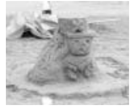
▲中沖小学校 『チョッパー』