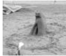
▲野方小学校 『かわいい子ねこ』