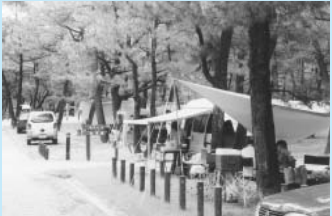
▲くいの松原キャンプ場

町議会の議決をいただいた後に各種手続きを進めていきますが、これ以外の施設についても状況をみながら順次、制度導入へ向けての検討を続けていくことにしています。