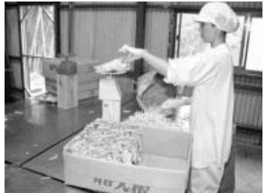
▲平成16年11月には、切り干し大根乾燥工場が完成。袋詰された製品は、県内外へ出荷されます。

当社も、この目標に少しでも近づけるよう、今後も規模拡大を図っていき、まわりの農家もいっしょになって野菜の生産をしていければと思っています。