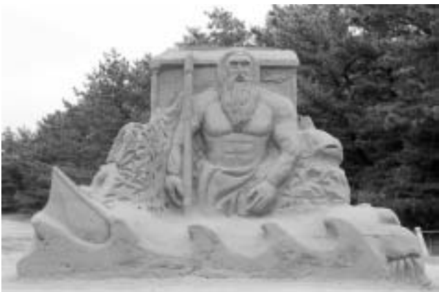
▲大丸砂像実行委員会 『ポセイどんと仲間たち』