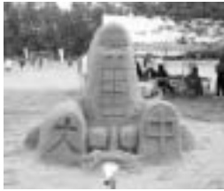
▲大崎中学校 『ディスカバリー』