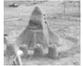
▲大崎小学校 『スペースシャトル ディスカバリー』