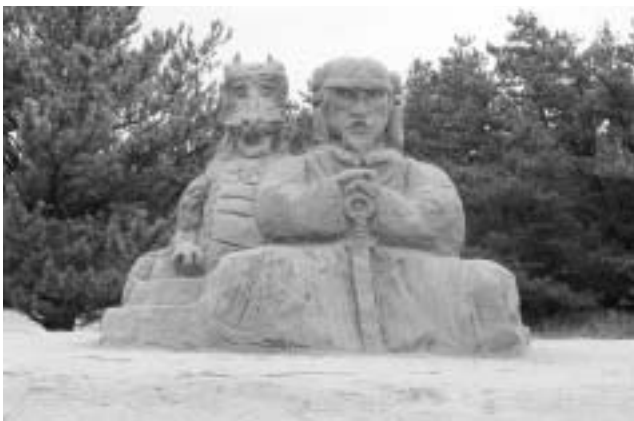
▲大崎町役場職員チーム 『海を支配した男』

8月20日(土)、大丸改善センター前特設広場において、大崎町では初の試みである砂像祭りが開催されました。 この砂像祭りは大丸公民分館砂像祭実行委員会(中倉広文委員長)が企画したもので、地元資源である白砂青松を生かしまちおこしと地域住民の交流を目的に、昨年からの準備を進めてきました。その資金集めのために、オリジナルTシャツや焼酎『松露の響き』の販売にも取り組んできました。 当分館はこれまでに、先進地である加世田市への視察や砂の