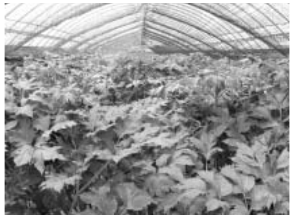
▲明日葉栽培の様子

また、『有機農産物の日本農林規格』に準ずる栽培方法の確立では、線虫抑制作物を栽培後の定植で、防虫ネットの被覆と天敵殺虫剤の放飼により、化学農薬を使用しない害虫防除が可能であることの成果が得られた。