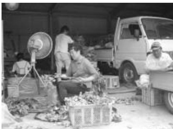
▲明日葉の収穫・調整作業