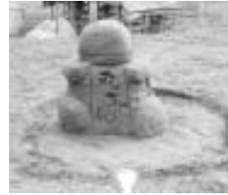
▲大丸小学校 『丸ちゃん』