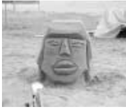
▲菱田小学校 『モアイ像』