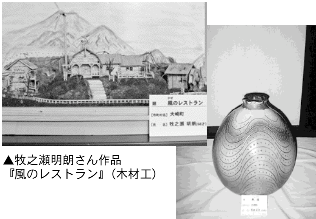
▲牧之瀬明朗さん作品 『風のレストラン』(木材工)