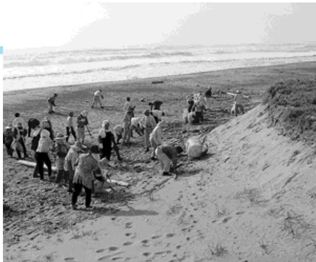
▲シルバーの日に会員総出で海岸清掃を実施

清掃終了後は、グラウンドゴルフやバーベキューなどを行い、会員相互の親睦を深めました。