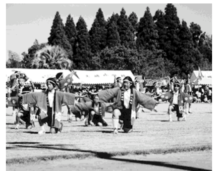
▲菱田小学生による『菱田ソーラン』