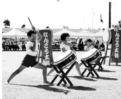
▲南光保育園児による太鼓演奏