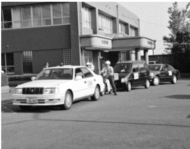
▲防犯ステッカーをはった車でパトロールに向かう ひまわり隊のみなさん