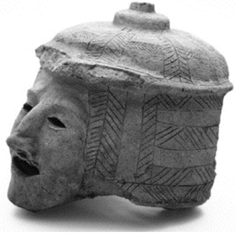
▲神領 10号墳で発見された武人埴輪

益丸から天子ヶ丘方面の台地を見ると、不自然に樹木に覆われた小さな丘が2つあり、その姿がイモ虫みたいだったので、小さいころ「イモ虫の森」と呼んでいた。中学3年生のころ、この「イモ虫の森」が神領古墳群の10号墳と11号墳であることを知って驚いた。私が考古学に関心をもち始めたのは、まさにこの時だったのかもしれない。