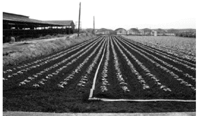
▲散水チューブにより活着および初期生育促進

これは，定植・生育期の降雨量が少なかったことと，出荷時期である 12 月の平均気温が平年より 3.2℃低かったことが原因と考えられる。