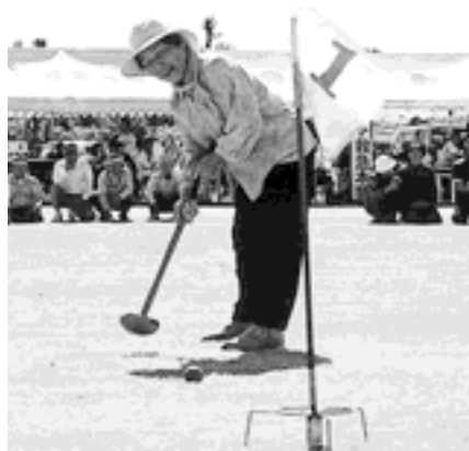
▲『やったぜ! ホールインワン』