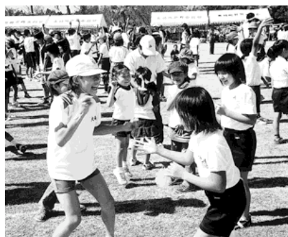
▲ジャンケンポン「ヤッター!」