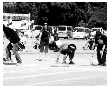
▲一般女子による「発車オーライ!」

10月8日、晴れ渡る秋空のもと、第54回町民体育祭が大崎中央運動公園において、盛大に開催されました。 大崎中学校吹奏楽部のマーチングで幕をあげ、中学生による『各部対抗リレー』、一般男女の『やったぜ! ホールインワン』・『なわとびレース』、分館代表による『分館対抗混合リレー』など、幼児からお年寄りまで楽しめる全27種目が大会を盛り上げました。 7色の旗を掲げた各公民分館が、深緑の優勝旗を勝ち取るため熱戦を繰り広げました。その結果、菱田公民分館が4連覇を達成し、見事優勝旗を手に入れました。