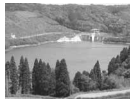
写真 輝北ダム (H19.5月撮影)