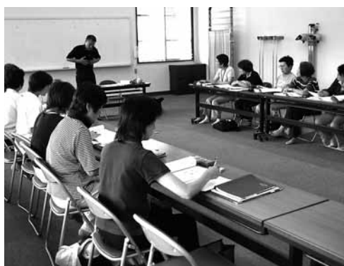
▲ 皆さん真剣に話し合い中……