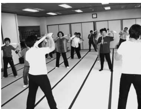
▲ タオルを使った体操。気持ちいい！