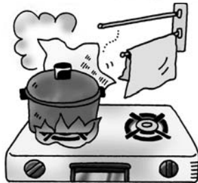
発火源別火災件数