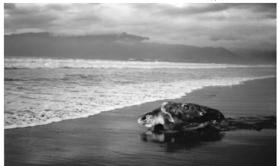
▲ 産卵を終え、海に帰るウミガメ