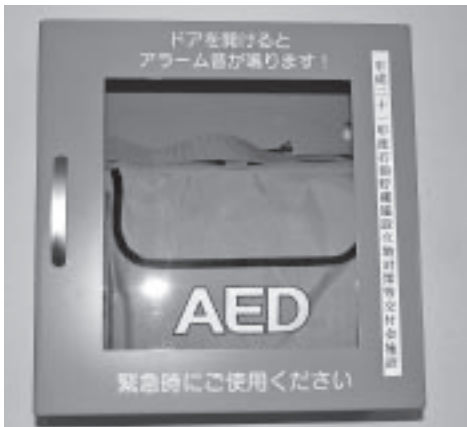
▲保健センターに設置されているAED