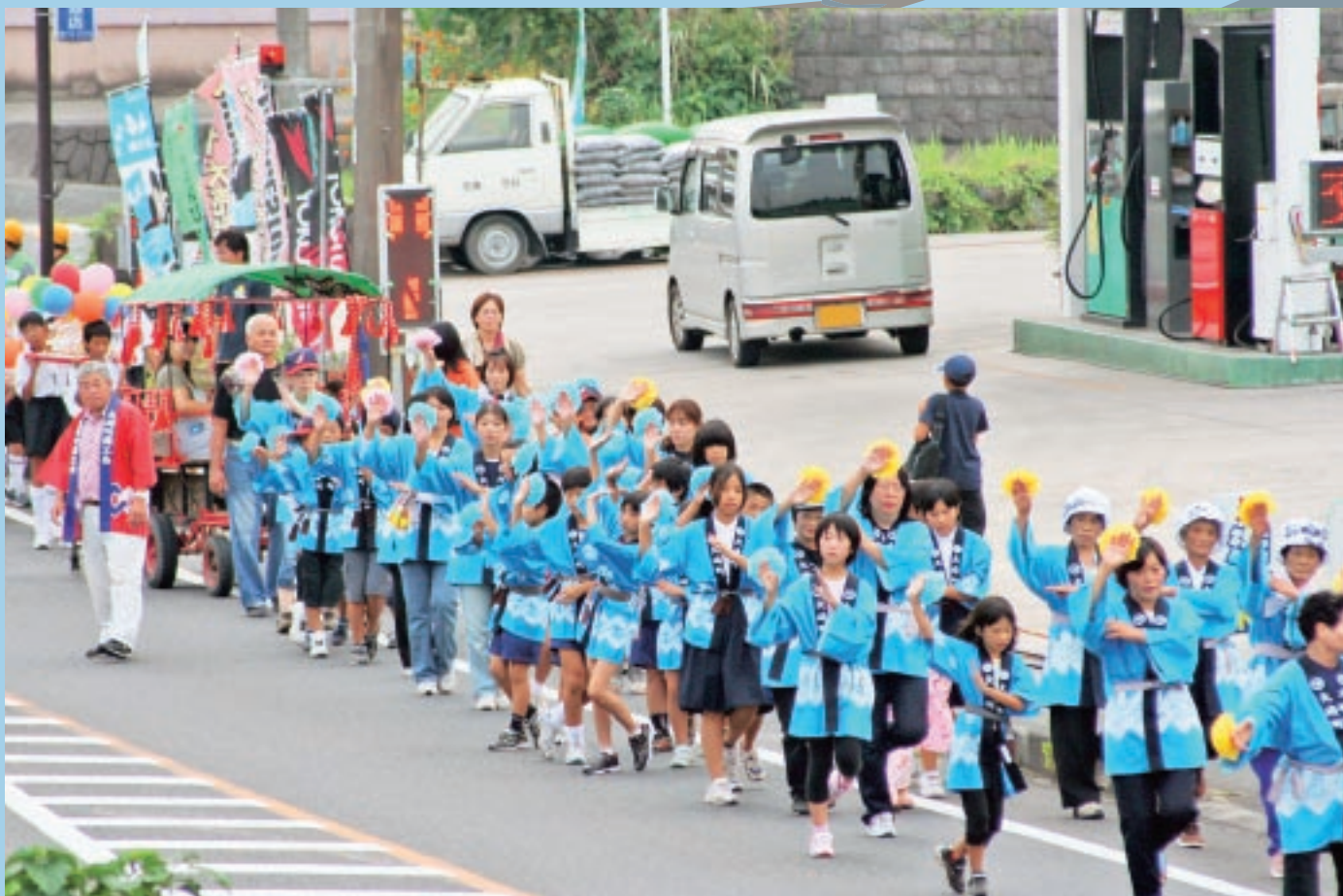
『野方ふるさと祭り～野方パレード隊～』