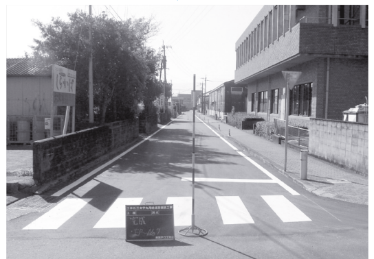
▲アスファルト舗装になった道路！

三文字丸尾線道路舗装工事完了にともない、廃材となったインターロッキングブロック（写真下）を無料にて提供します。先着順です。お早めにご予約ください。 ※積み込み・運搬は、希望者が行ってください。 ※引き渡しは毎週水曜日13時から行います。 【受け付け期間】 平成21年5月31日まで 【お問い合わせ先】 大崎町役場 建設課 TEL 476-1111 (内線240-241)