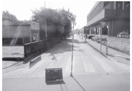
▲インターロッキングブロックの道路！