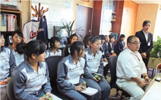
▲ 26期生となる研修生が町長を表敬訪問しました。