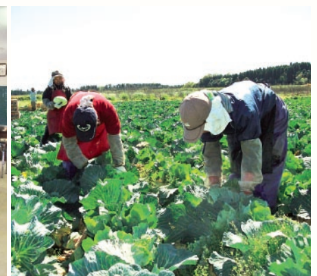
▲農場での実践実習風景

事業協同組合ヒューマンサポートでは、農業分野を中心に外国から青年労働者の受け入れを行なっています。 現在は、中国の送り出し機関と連携しており、企業希望人数を現地で面接を行い、年間100人程度の研修生を受け入れているそうです。 同協同組合では、研修生が習得した『技術・技能・知識』を母国に持ち帰って活用することにより開発途上国の農業の振興や社会経済発展の担い手となる『人づくり』に協力することを目的としています。 研修期間は、3年間で、入国後約1ヶ月間事前研修を行いません。