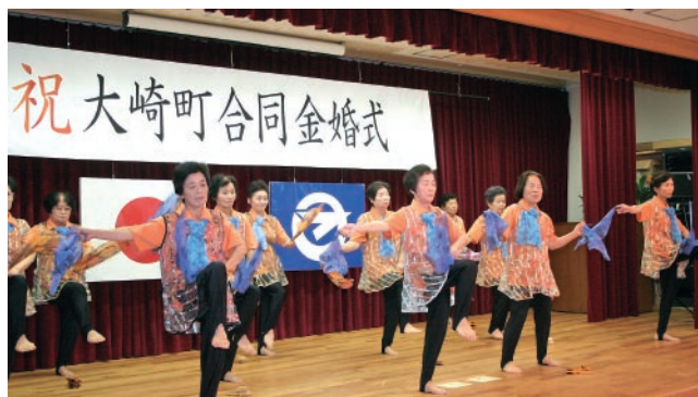
▲平成21年度の金婚式での風景。結婚50周年を祝って披露しました。