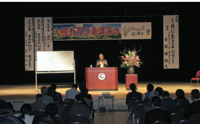
▲ひとり一人が、『思いやりの心』と『かけがえのない命』を大切にすることが今まさに求められています。

また、人権標語コンクールの表彰式なども行なわれ、参加者は“人権”について、改めて考え直すきっかけとなりました。