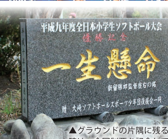
▲グラウンドの片隅に残る記念碑は、全国制覇を記念して建てられたものです。