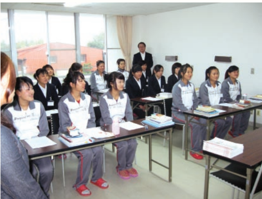
▲事前研修風景 日本語や日本のマナーなど約1ヶ月間学びます。