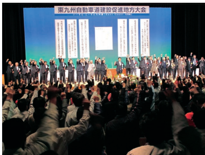
▲「早期完成に向けて頑張ろう！」と頑張ろう三唱を行ないました。

九州の一体的発展には不可欠として、東九州道の一部も早い全線開通実現に向け、関係機関等に積極的にアピールしていくことを確認しました。