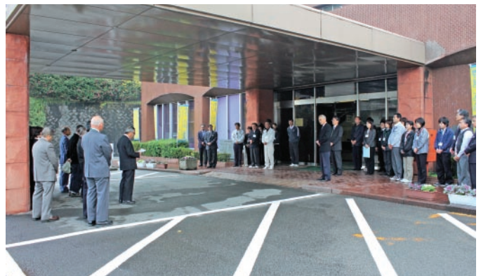
▲曾於部会人権キャラバン隊が役場を訪れメッセージを届けました。

人権とは、すべての人が生まれながらに持っている、幸せに生きていくための権利です。あらゆる差別や偏見をなくし、みんなが明るく暮らせる社会をつくるために、もう一度、身近なことから人権を考えてみてください。