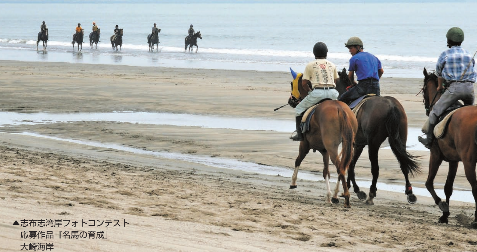
▲志布志湾岸フォトコンテスト 応募作品『名馬の育成』 大崎海岸