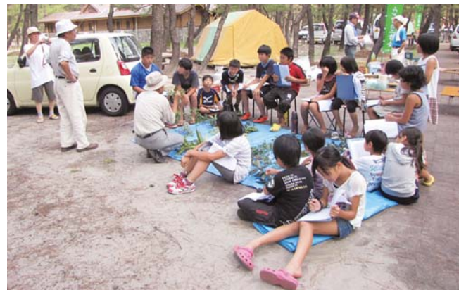
▲この経験を生かし何にでもチャレンジしてください。

参加者は、キャンプ場周辺を木の名前を覚えながら散策し、その後識別試験が行われ、正解数に応じて、10級から2段までのジュニア樹木博士の認定証が授与されました。