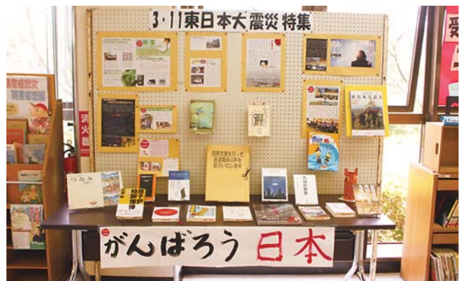
▲図書館展示コーナー