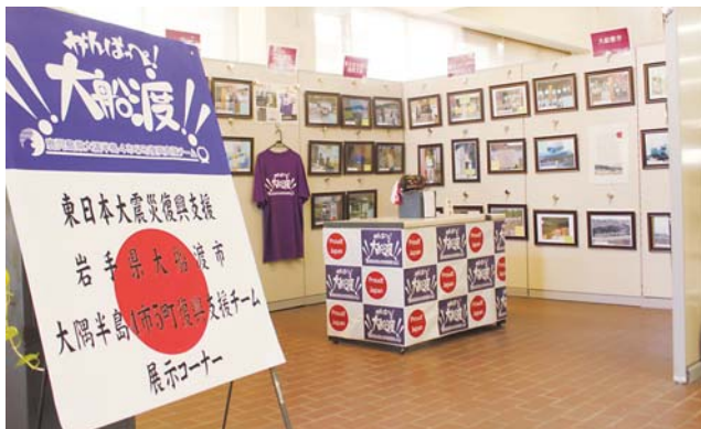
▲役場1階ロビー展示コーナー

なお、図書館では、東日本大震災の写真集をはじめ、節電関連の本など展示してありますので、ご利用ください。