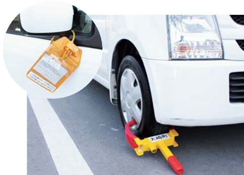
タイヤロックによる自動車の差押

差押えた不動産等は『公売』、金銭債権は『取立て』により、差押え財産の換価（＝換金）を行います。