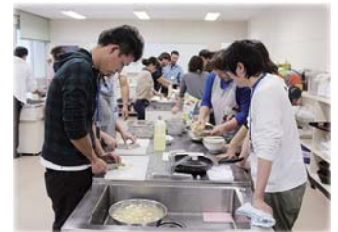
▲昨年、町農業青年倶楽部が主催した恋活イベントの様子