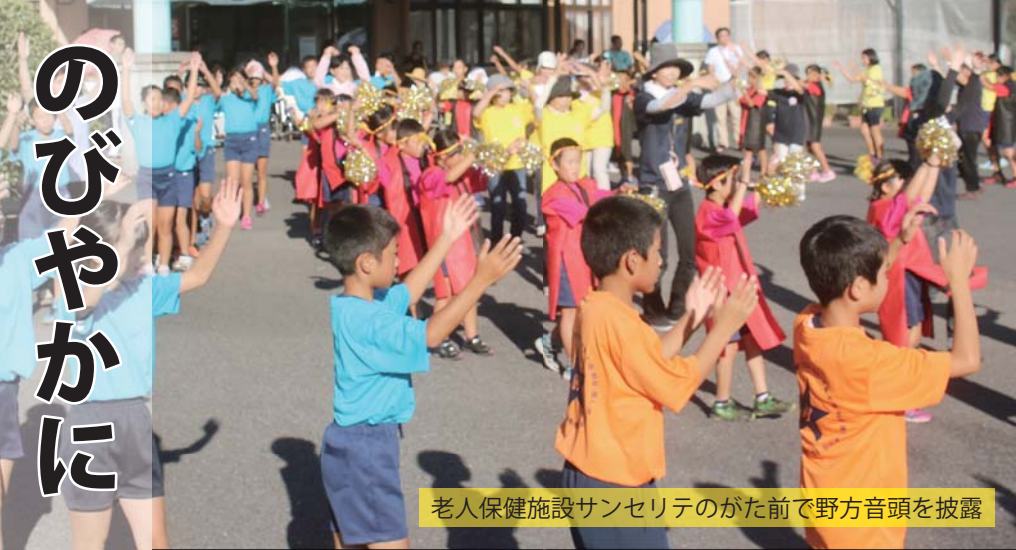
老人保健施設サンセリテのがた前で野方音頭を披露