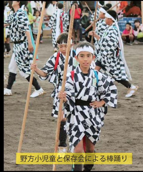
野方小児童と保存会による棒踊り