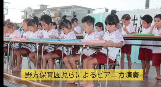
野方保育園児らによるピアノ演奏