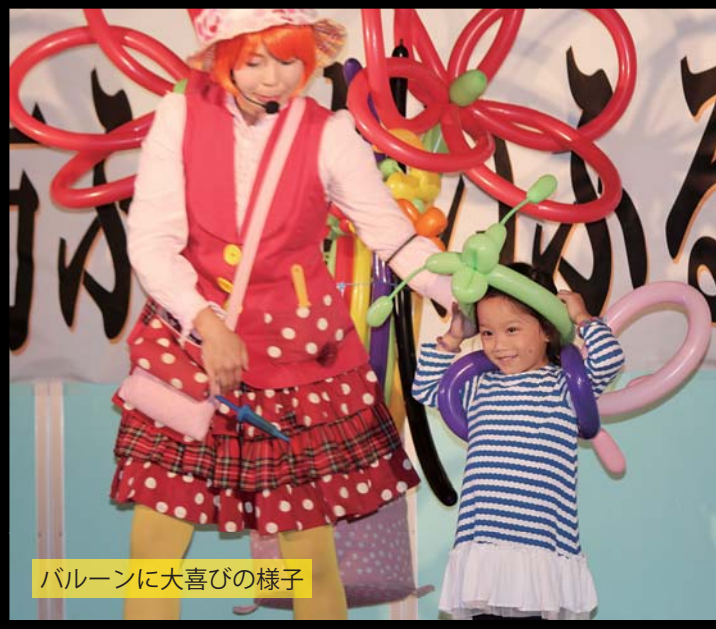
バルーンに大喜びの様子