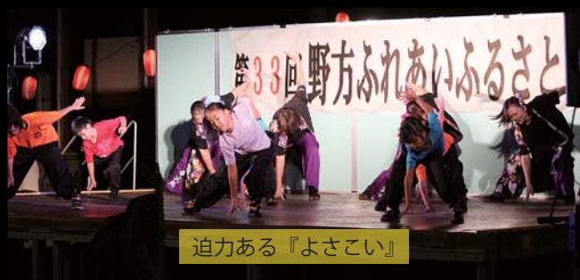
迫力ある『よさこい』