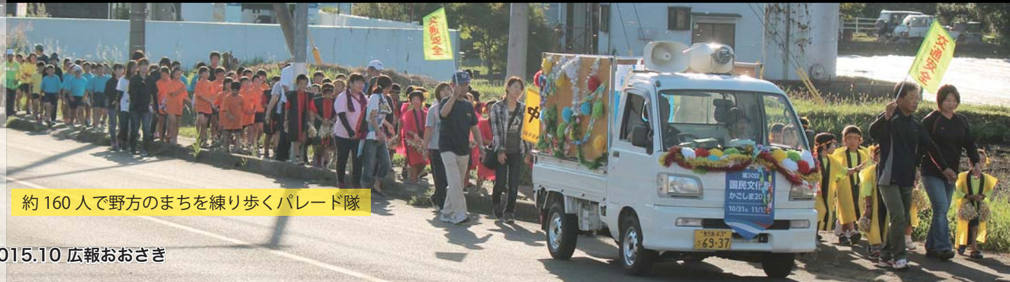
約160人で野方のまちを練り歩くパレード隊