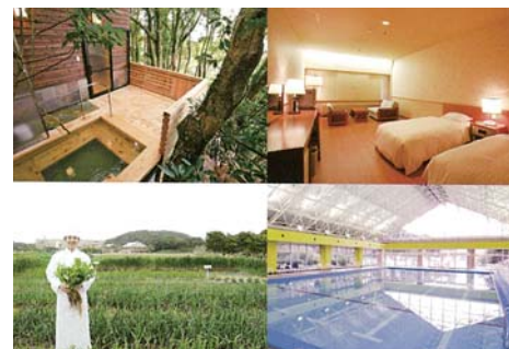
▲指宿ベイテラス HOTEL & SPA

今や2人に1人はがんを患う時代です。陽子線治療という楽な治療プロセスがあることを、選択肢としてぜひ知っていただければと思います。