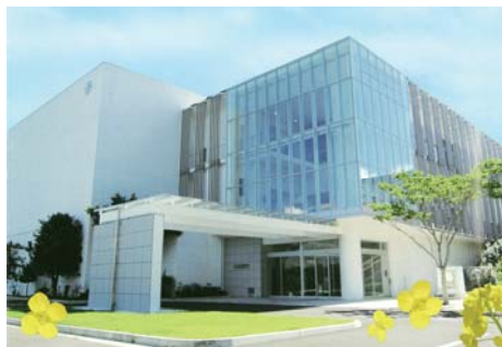
▲メディポリス国際陽子線治療センター

これまでのがん治療は手術であれ、抗がん剤であれ、治療のプロセスが大変辛いものでした。粒子線治療は痛くも熱くもなく、点滴などチューブ類も一切つけません。照射時間は1回あたり数分で、これを4～40回、数週間かけて行います。