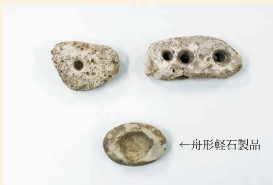
写真1 沢目遺跡出土遺物

このように、弥生時代になるとより生活の営みに直結する信仰になっていき、それに伴うさまざまな道具を用いるようになります。