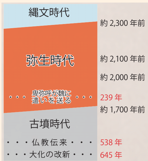
図1 弥生時代の年表

約2300年前から約1700年前の約600年間を『弥生時代』と呼んでいます。縄文時代では、狩猟採集によって食料を確