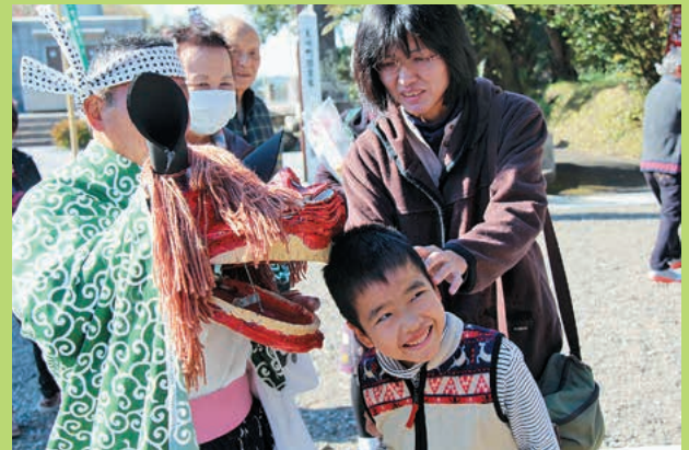
▲獅子舞に厄をはらわれ笑顔を見せる子ども

獅子舞は厄をはらうと言われており、参拝者らは自ら頭を近づけ獅子舞に噛まれ喜んでいました。