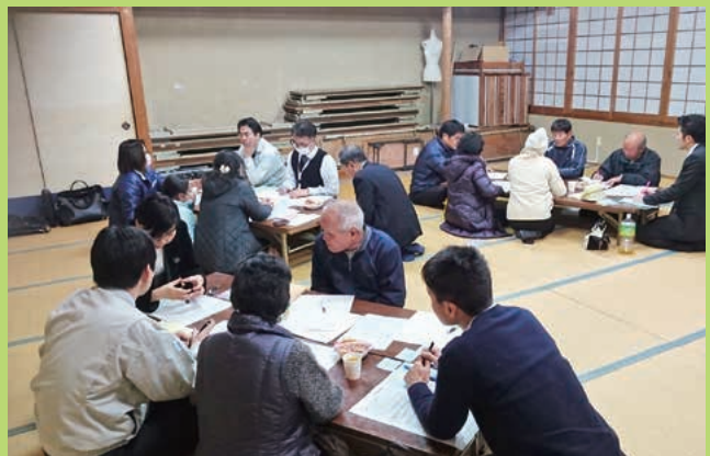
▲地元を活性化させるための活発な議論が行われました

平成26年度から始まった本事業は最終段階に入っており、各グループは、数か月以内に実行する短期計画、中期計画（1～2年以内）、長期計画（3～5年以内）について、内容の再確認を行いました。3月には計画書の発表を予定しているとのこと。