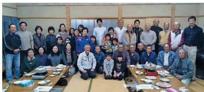
牧之内集落の皆さん