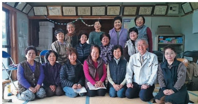
仮宿下いきいきサロンの皆さん