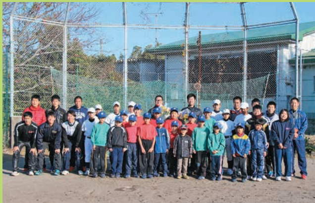
▲大崎ソフトの先輩後輩ら全員で記念撮影

1月3日（火）、研修センターグラウンドにおいて、大崎ソフトボールスポーツ少年団の練習始め式が行われました。