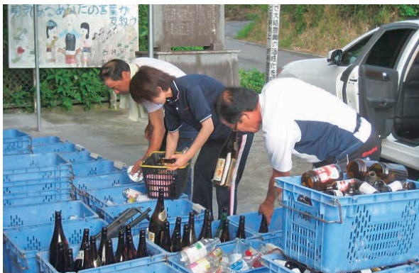
▲資源ごみを分別している様子