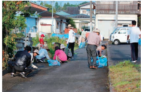
▲集落一斉ボランティア清掃作業の様子