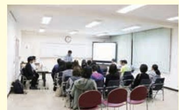
【前回の説明会の様子】

大崎町リサイクル未来創生奨学金制度について、わかりやすく説明いたしますので、ぜひご参加ください！