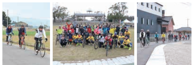
【前回のイベントの様子】