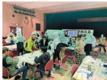
防災カップづくりの様子

最後に再度、日本人の方と外国人の方が一緒になって、非常持出グッズの確認、急な雨や防寒対策に使える防災カップづくり、災害時に流れる放送や緊急車両のサイレンの確認をおこないました。