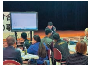
サイレン音の確認の様子