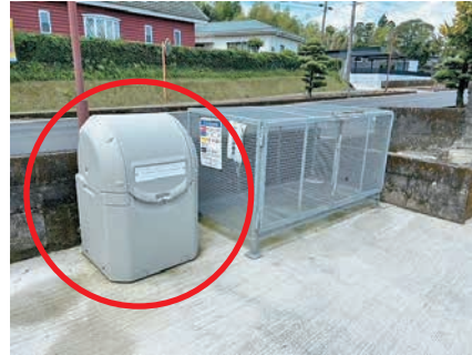
回収ボックスの設置状況