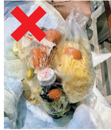
↑ 茶瓶・生ごみ等の混入

※新聞紙や金属などは、 設備の故障につながり ますので、混入しない ようお願いします。 ※新聞紙、ゴム手袋、 ティッシュ、ペット用 おむつ、衛生用品は一 般ごみになります。