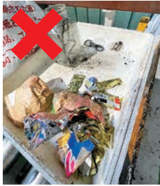
↑ ガラス瓶・金属類・ プラスチックの混入