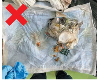
↑ 茶瓶・ペットシート・ 一般ごみ等の混入