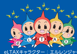
eLTAXキャラクター：エルレンジャー